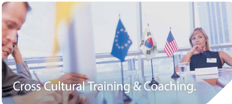
Cross Cultural Training & Coaching.

Neugier, Akzeptanz und Respekt gegenüber anderen Kulturen sind in der globalisierten Arbeitswelt stärker denn je gefragt. Doch wie geht man mit Unterschiedlichkeit richtig um? Andere Länder, andere Sitten – so der Volksmund. Trainings hierzu gibt es einige. Entscheidend aber ist, dass sie von persönlicher Praxiskompetenz durch langjährige Auslands- und Arbeitserfahrungen geprägt sind.